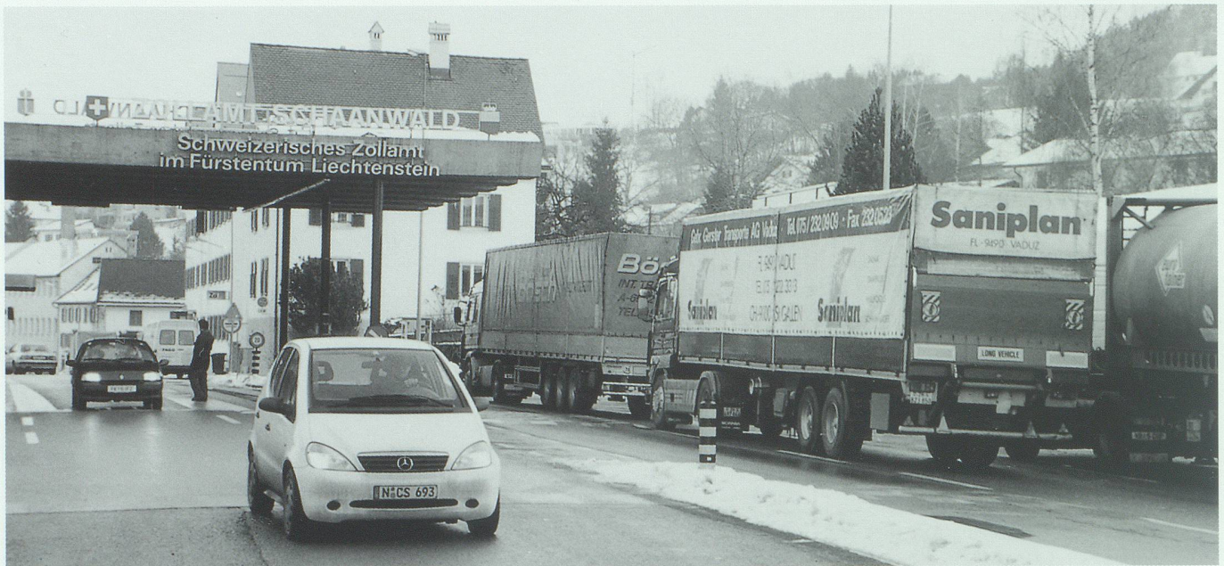
Randregionen und Grenzen werden von den Zentren aus definiert. In der Zukunft wird der grenzüberschreitende Austausch neue Entwicklungschancen geben.

lisierung einzelner Teilstrecken auch im Hinblick auf die Vergrößerung der Freiräume einen wesentlichen Beitrag.