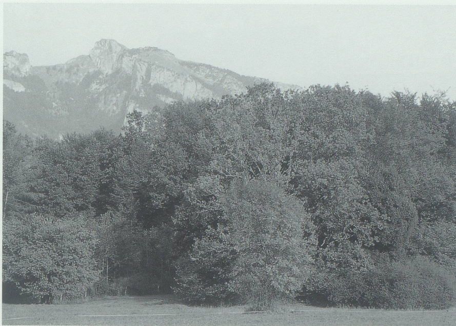
Grenzräume – so auch Waldränder – sind Zonen des Austauschs und bereichern das Ganze.

Die Idee setzt sich durch, dass den ökologischen Grenzen vermehrt Raum zu gewähren ist. Wir müssen anerkennen, dass wir nicht mehr die Verhältnisse der zwanziger Jahre erreichen können. Aber es sollte möglich sein, die Waldränder und Gewässer zum ökologischen Rückgrat und Basisnetz unserer Nutzlandschaft umzuformen. Wo die Waldränder an das Kulturland stossen, bilden sie einen gestuften, vielfältigen Übergang vom Grasland zum Waldbestand. Unsere Gewässer erhalten mehr Raum oder werden so umgestaltet, dass sie Leben zulassen und den Austausch fördern. Der Rhein als wichtigstes Gewässer