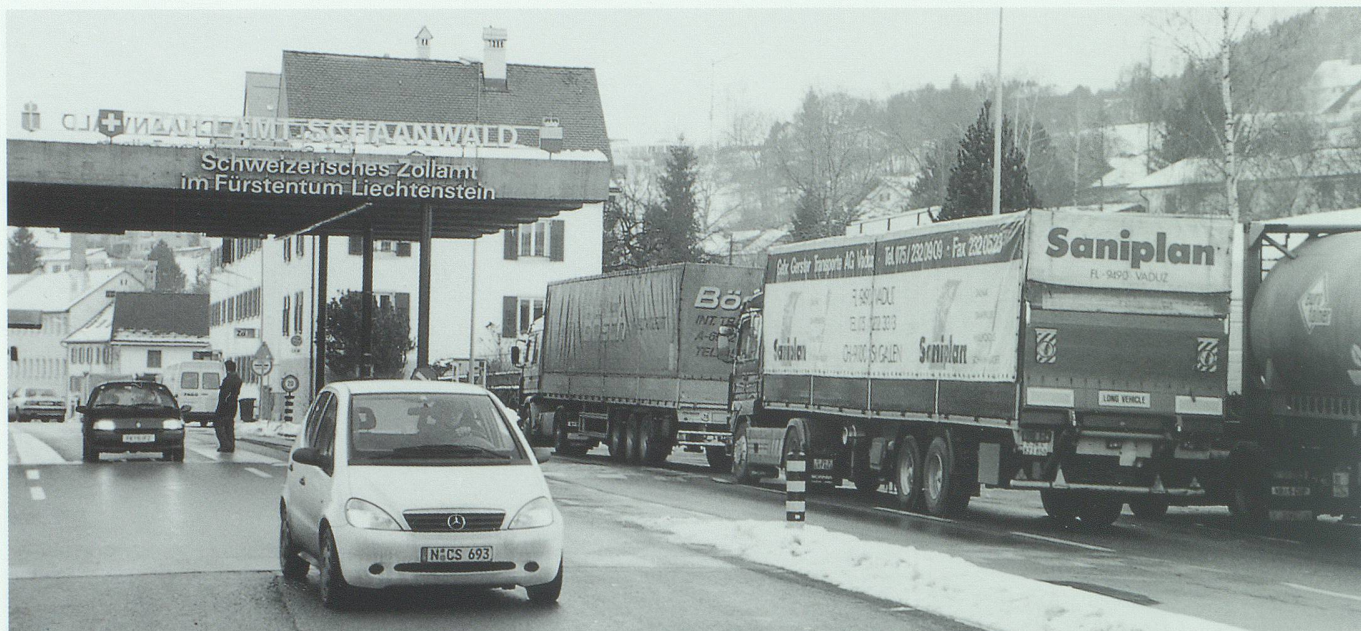
Randregionen und Grenzen werden von den Zentren aus definiert. In der Zukunft wird der grenzüberschreitende Austausch neue Entwicklungschancen geben.

lisierung einzelner Teilstrecken auch im Hinblick auf die Vergrößerung der Freiräume einen wesentlichen Beitrag.