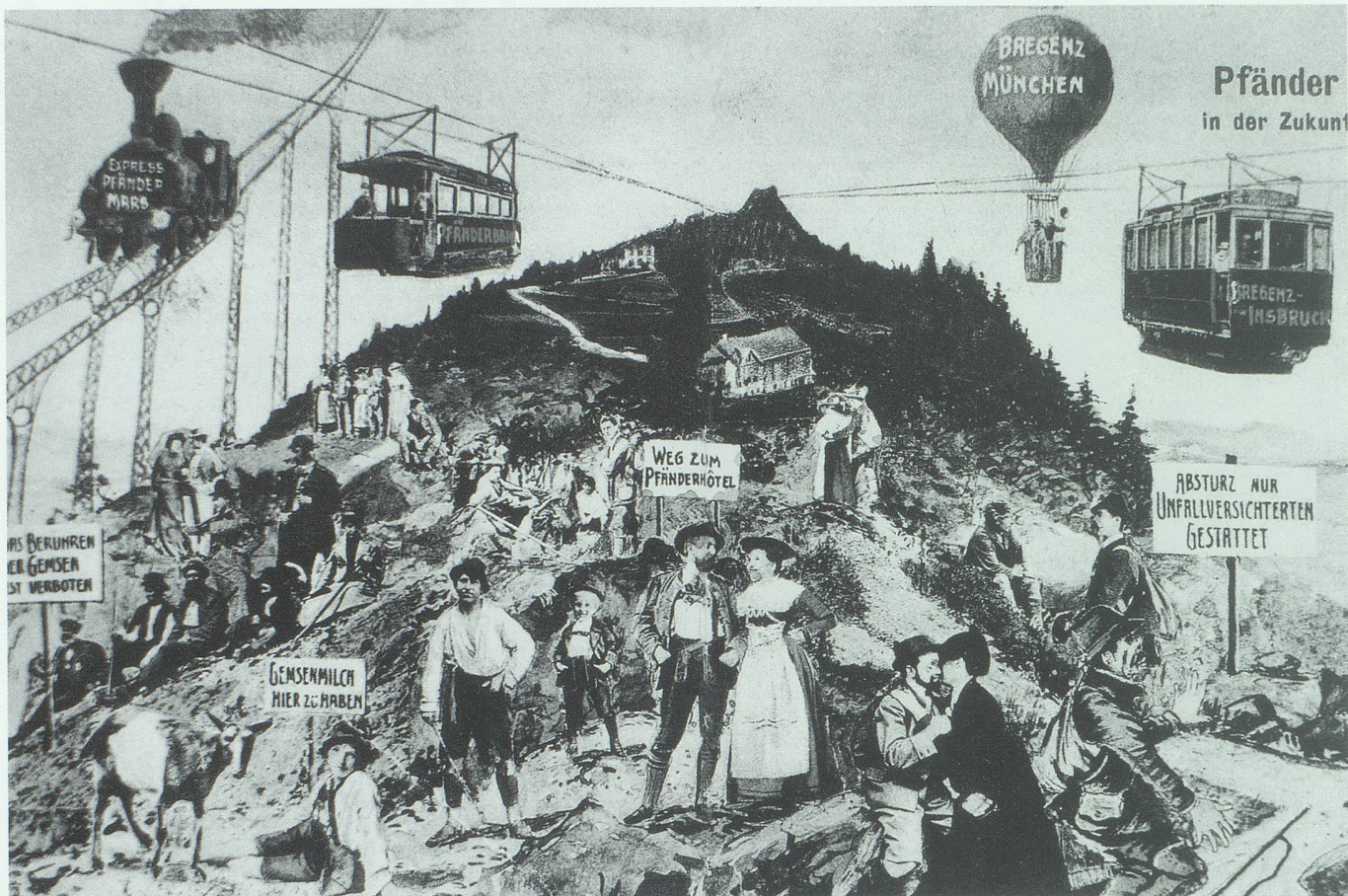
Bereits vor über hundert Jahren zeichnete man die Auswüchse des Tourismus und der technischen Erschließung der Landschaft. Nach einer Postkarte um 1890. Bild aus «Ausblicke der Ewigkeit. Zeitschwellen am Bodensee», Hg. Hans-Peter Meier-Dallach, Lindenberg 1999.

ministrativen Hürden ohne weiteres überspringen.