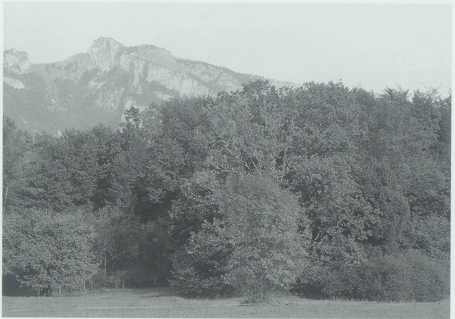
Grenzräume – so auch Waldränder – sind Zonen des Austauschs und bereichern das Ganze.

Die Idee setzt sich durch, dass den ökologischen Grenzen vermehrt Raum zu gewähren ist. Wir müssen anerkennen, dass wir nicht mehr die Verhältnisse der zwanziger Jahre erreichen können. Aber es sollte möglich sein, die Waldränder und Gewässer zum ökologischen Rückgrat und Basisnetz unserer Nutzlandschaft umzuformen. Wo die Waldränder an das Kulturland stossen, bilden sie einen gestuften, vielfältigen Übergang vom Grasland zum Waldbestand. Unsere Gewässer erhalten mehr Raum oder werden so umgestaltet, dass sie Leben zulassen und den Austausch fördern. Der Rhein als wichtigstes Gewässer