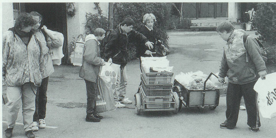
Mit Sack und Pack zogen Schüler und Lehrer ins Provisorium und nach kurzer Bauzeit wieder zurück ins neue Schulhaus.

Wir leben in einer Zeit der harten Berechnungen, in einer Zeit, in der die öffentliche Hand weniger Geld zur Verfügung hat, in einer Zeit, in der wir zu unseren sozialen Errungenschaften Sorge tragen müssen. Um so mehr freute sich der Vorstand der Heilpädagogischen Vereinigung Sargans-Werdenberg, der Öffentlichkeit eine zweckmässige Schulanlage übergeben zu können.