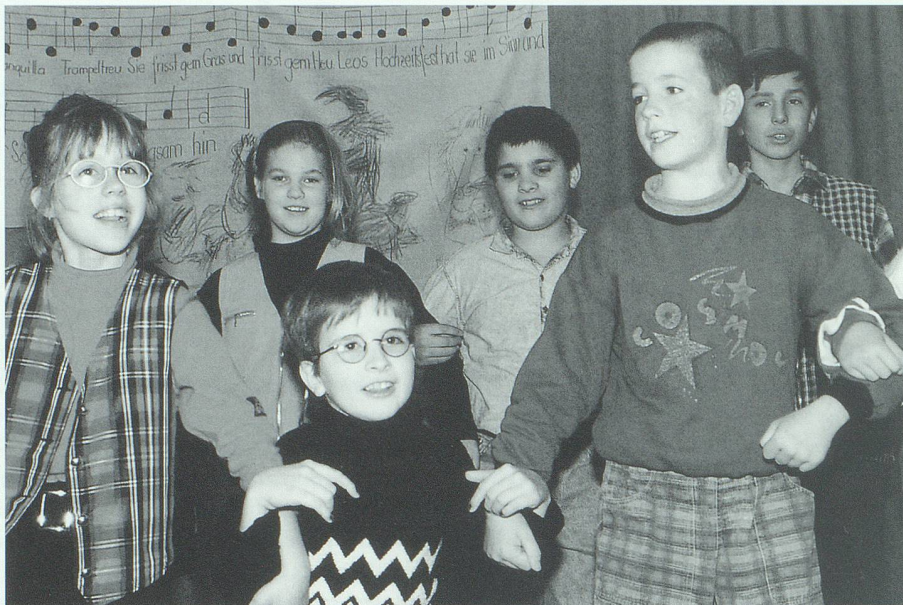
Mindestens so gross wie bei Lehrern und Behörden war die Begeisterung bei den Kindern über die neuen oder neugestalteten Räume ihrer Schule. Stolz präsentierten sie an der Einweihungsfeier ihr Theaterspiel.

zunächst abschlägig beantwortet. Da die Schülerzahl ständig wuchs, war man gezwungen, einen Pavillon zu mieten und aufzustellen. Für die kommenden Jahre belegten die offiziellen statistischen Angaben deutlich, dass zusätzlicher Schulraum benötigt wurde. Schliesslich beauftragte der Kanton im Jahr 1994 den Vorstand, die Planung eines Erweiterungsbaues und die Sanierung des bestehenden Gebäudes an die Hand zu nehmen.