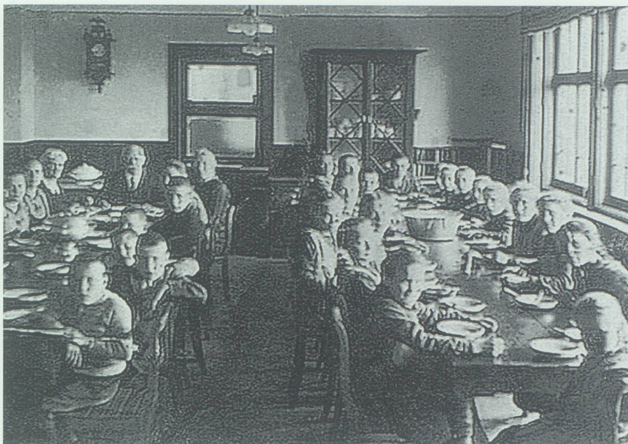
Der Speisesaal der Werdenbergischen Erziehungsanstalt in Grabs im Jahr 1915.

gegliederten Gutsbetrieb zu arbeiten, die Mädchen, geringer an der Zahl, im und ums Haus. Die Dorfbewohner mieden den Kontakt mit den Heimkindern, die sie «Anstaltler» nannten – die der untersten sozialen Stufe angehörten.