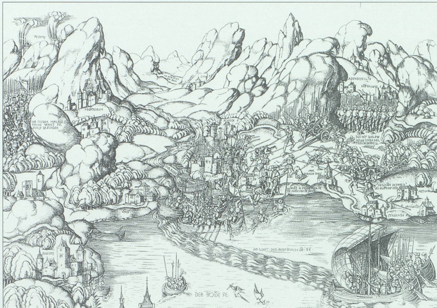
Die Schlachtenzeichnungen des Kölner Meisters P. W. widerspiegeln mit ihrem Versuch, ganze Landschaften zu erfassen, sowohl die neuen räumlichen Vorstellungen der Renaissance wie auch das verstärkte strategische Denken der Kriegsgegner.

Vor 500 Jahren waren die Büchsen technisch noch lange nicht ausgereift, und ihre Handhabung war recht gefährlich. So legte man ganz besonderen Wert auf entsprechende Sicherheitsvorschriften. Streng verboten war es beispielsweise, während des Schiessens zur Scheibe zu gehen. Wollte man bezüglich seines Schusses etwas wissen und nachprüfen lassen, dann musste