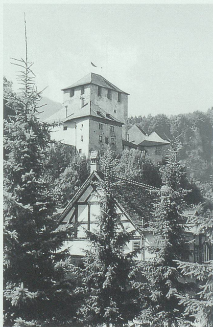
Die Feldkircher Schattenburg.

Vorsorglich hatte Maximilian «seine» Stadt Feldkirch schon in den Jahren zuvor entsprechend gerüstet, da er glaubte, an Feldkirch führe kein Weg vorbei, und bei entsprechendem Ausbau der Verteidigungsanlagen wäre der Weg zum Arlberg und weiter nach Tirol für jeden Angreifer versperrt.