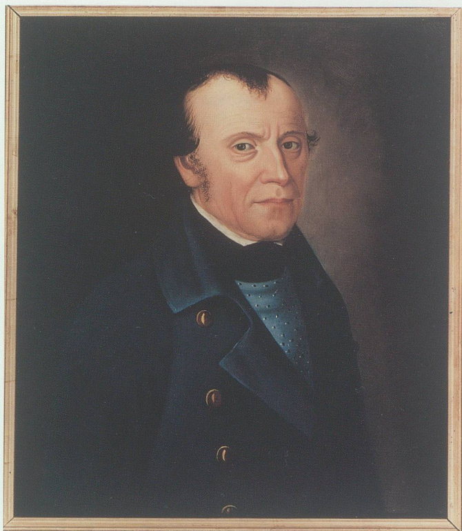
Alexander Müller um 1800. Öl auf Leinwand. 48 x 56 cm. Undatiert und nicht signiert. Bei Urs Haefliger, Küsnacht.

den Familien gefördert. 6 Diese Angehörigen der lokalen Oberschicht, wirtschaftlich und bildungsmässig kaum schlechter gestellt als viele ihrer Herren, empfanden ihre politische Ohnmacht und persönliche Abhängigkeit bis hin zur Leibeigenschaft (wie im Falle der Müller von Fontnas) als besonders stossend und demütigend. Sie wurden zu den eifrigsten Befürwortern aufklärerischer Ideen und später zu den Trägern der Helvetischen Revolution. 7 Die Aufzeichnungen «Das Geschlecht Müller von Fontnas» sind vor dem Hintergrund dieser geistesgeschichtlichen und politischen Strömungen zu sehen. Für Alexander Müller waren «Freyheit» und «Freyheits-Geist» 8 zentrale Themen seiner Darstellung. Er wusste aufgrund seiner Quellenkenntnisse, dass die Freiheit, wie sie die zeitgenössische Historiographie in der republikanischen Urschweiz mit ihren Reichsprivilegien verherrlichte, für seine Heimat auch im Mittelalter nie Gültigkeit erlangt hatte. Wartau, Werdenberg und Sargans waren schon unter den Grafen von Werdenberg und später unter wechselnden Herren bis zur Übernahme durch eidgenössische Orte Untertanenlande gewesen. Um so grössere Bedeutung mass Alexander Müller dem «Freyheits-Geist» zu, dem Drang nach der ursprünglichen Freiheit im Sinne der Aufklärung. In ihm sah er den Grund für die Weigerung der Sargan-