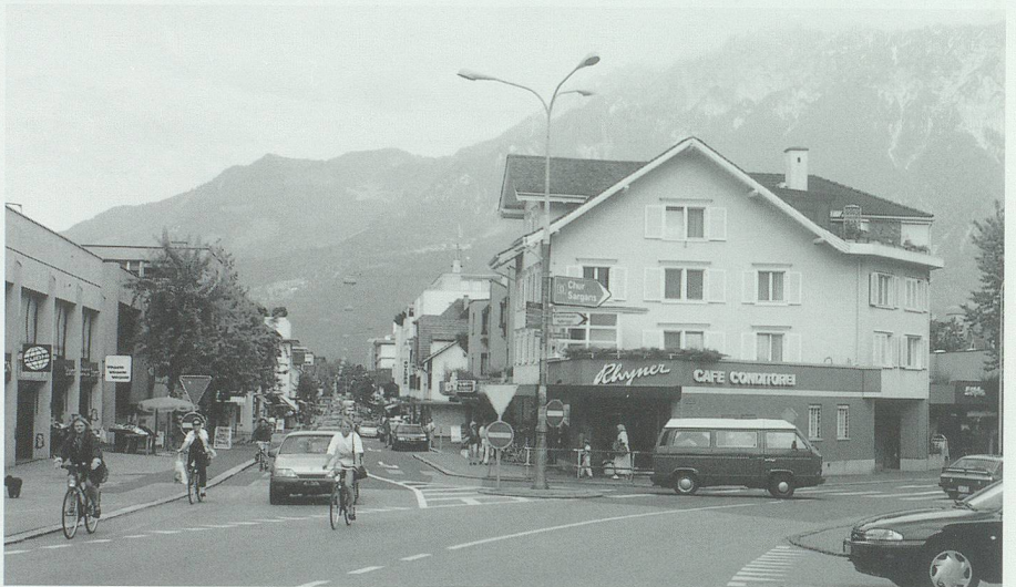
Ochsenkreuzung in Buchs 1996: Die Fläche dient als Verkehrsknoten: Verkehrsteiler, Strassenmarkierung, Strassenkandelaber und Reklameschilder beeinflussen das Strassenbild. Den Fussgängern werden erhebliche Umwege zu den Fussgängerstreifen zugemutet.

das Trottoir zu benützen. Das 1958 beschlossene und heute (mit nachträglichen Änderungen) gültige Strassenverkehrsgesetz hält es nicht anders. Es schreibt in Art. 49 vor: «Fussgänger müssen die Trottoirs benützen. Wo solche fehlen, haben