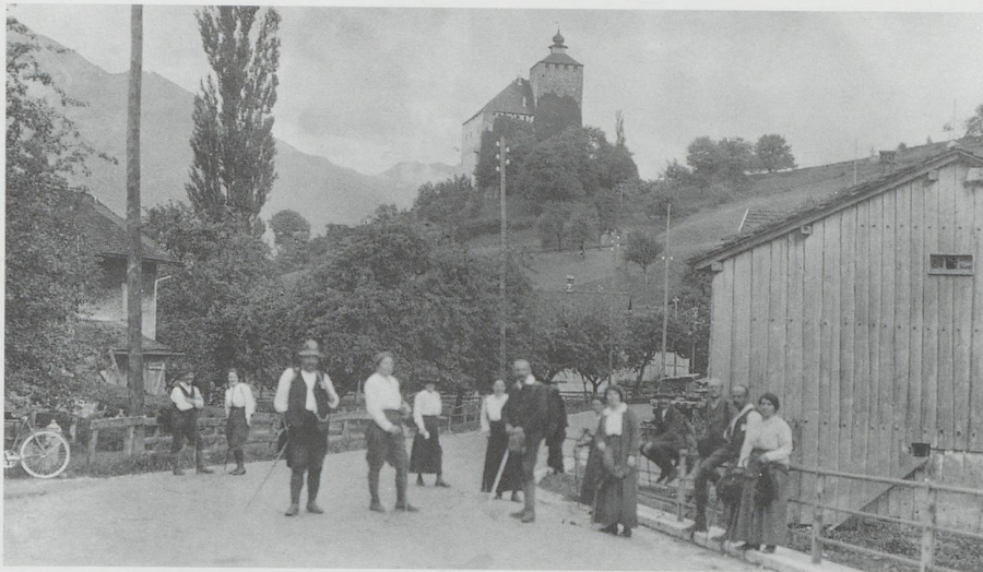
Bei der Brücke über den Lognerbach in Werdenberg 1915.