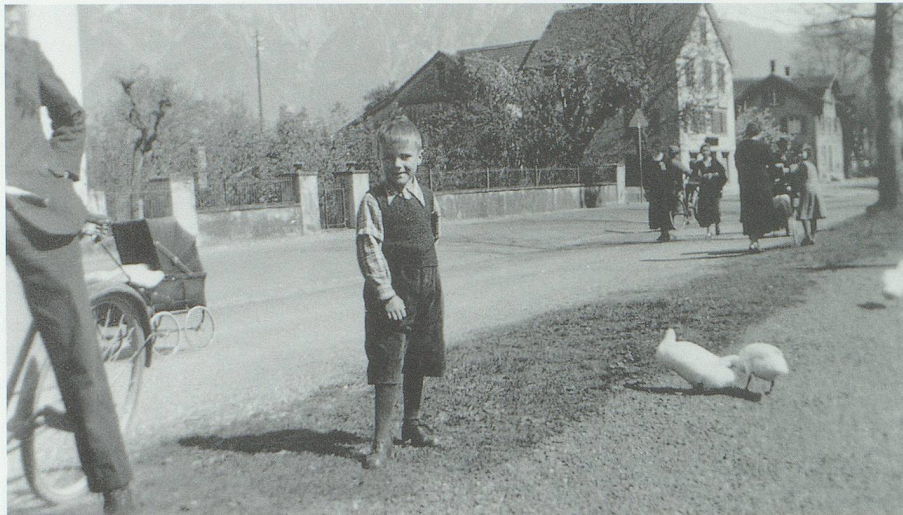
St.Gallerstrasse am Werdenbergersee 1940: Noch ist die Strasse ein Teil des Flanierweges.