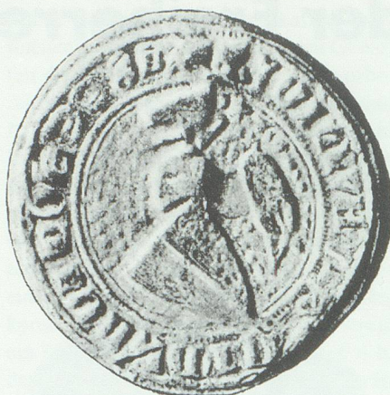
Siegel des Ulrich Brancho von Sax.