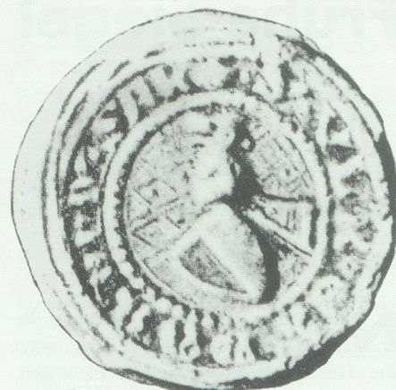
Siegel des Ulrich Eberhard von Sax.

die für die staufische Macht und Politik von grosser Bedeutung waren. Dem Besitzer der Herrschaft Misox, einem saxischen Stammland, kam eine eigentliche Schlüsselstellung der Nord-Süd-Achse zu. Anfang des 13. Jahrhunderts dehnten die Saxer ihren Besitz nach Norden aus und beherrschten nun auch den Verkehr im St. Galler Rheintal, einer wichtigen Etappe auf der Route Bodensee-Italien.