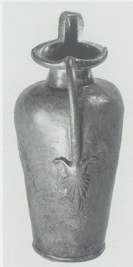
Abb.3: Bronzeschnabelkanne aus Castaneda nach etruskischem Vorbild mit Inschrift im Alphabet von Sondrio, 5. bis 4. Jahrhundert v. Chr. (Bild Rätisches Museum, Chur.)

nen Überblick und Vergleich des Forschungsstandes.