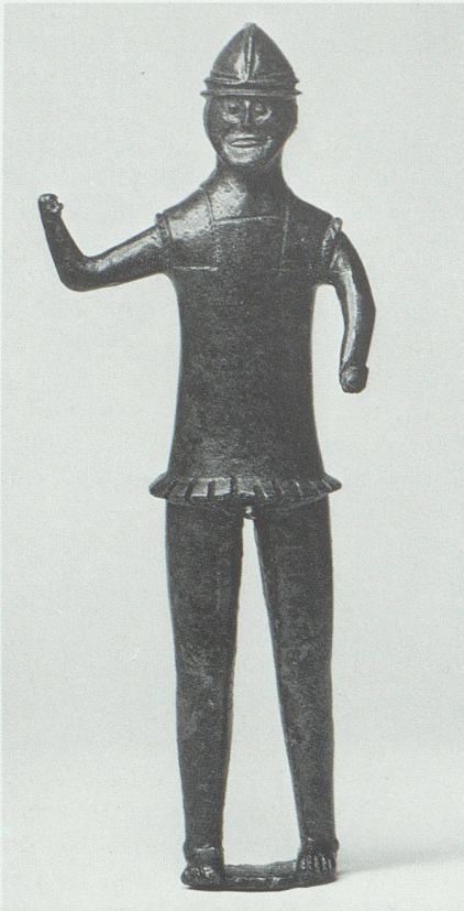
Abb.4: Kriegerstatuette vom Opferplatz Gutenberg bei Balzers, 13,2 cm hoch. Der «Mars» von Balzers trägt Brustpanzer und Negauerhelm, wie sie seit dem 4. Jahrhundert v. Chr. für die Anführer bezeugt sind; Schild und Lanze sind nicht erhalten.

Dies deutet darauf hin, dass damals im Alpenrheintal eigentliche Handelsniederlassungen von «Südtirolern» bestanden.