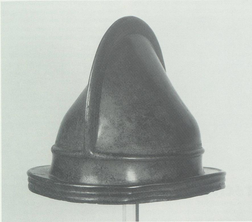
Abb.6: Negauer Helm aus Igis GR mit breiter Kehle und Krempe sowie Kamm für den Helmbusch.

fen, wie sie auch die Etrusker nach griechischem Vorbild gestalteten.