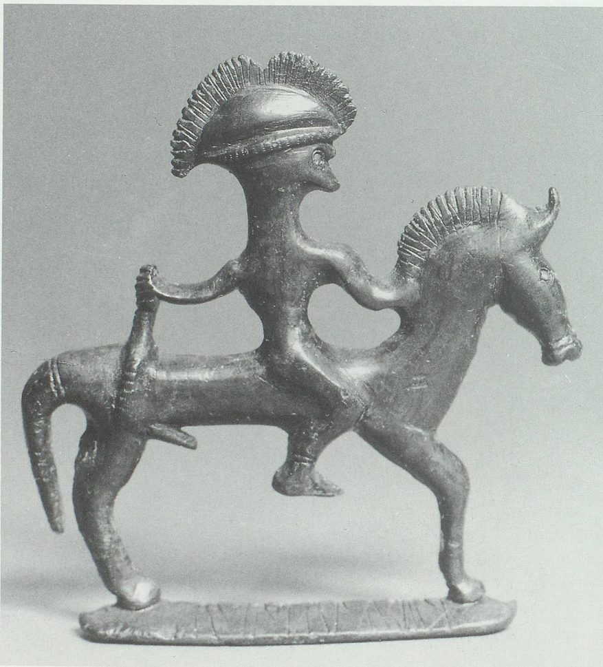
Abb. 1: Votivfigürchen eines Reiters aus Sanzeno im Nonsberg (Provinz Trento) aus dem 5. bis 4. Jahrhundert. Der Reiter trägt den sogenannten Negauerhelm mit aufgesetztem Helmbusch. Auf der Standleiste des Pferdes befindet sich eine Inschrift.

Bereits in der Antike sahen norditalische Römer in den Rätern Nachfahren der rätselhaften mittelitalischen Etrusker. Die Quellen der antiken Geschichtsschreibung geben aber keine Auskunft darüber, ob es sich bei den Rättern um einen Stammesverband mit kultischer oder sogar politischer