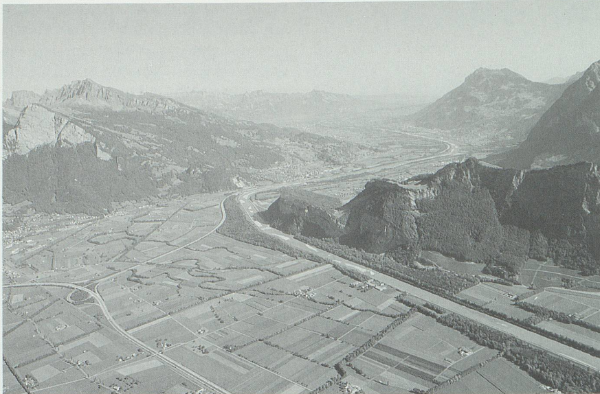
Die Ebene zwischen Sargans und Ragaz, rechts der Fläscherberg, im Hintergrund das Rheintal mit dem Bezirk Werdenberg und dem Fürstentum Liechtenstein. Auf dieses Gebiet bezog sich die frümittelalterliche Bezeichnung «in Planis» (bei den Ebenen).

850 tragen nur in Cazis mehr als 12 Prozent der Genannten germanische Namen. Ein Vergleich mit den etwa gleichzeitigen Listen des lombardischen Klosters Leno bei Brescia ist aufschlussreich: dort tragen von 220 erwähnten Personen deren 151 (also 69 Prozent!) germanische Namen. Und in einer Liste der Kanoniker der Stephanskirche zu Lyon sind es zur selben Zeit gar 82 Prozent germanische Namen! Der Gegensatz zu Graubünden könnte kaum auffälliger sein. 15