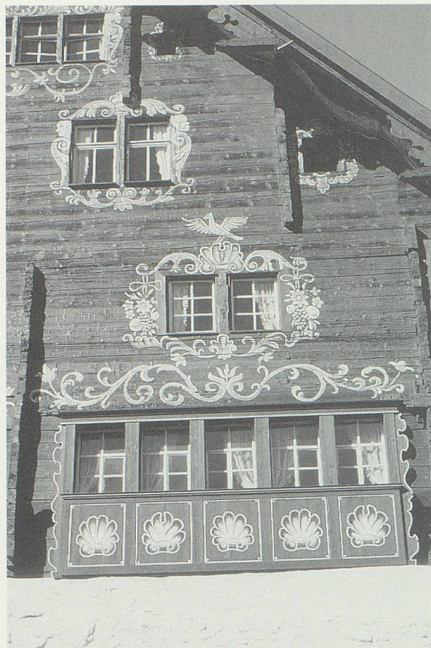
Hinter den Fenstern des «Schlangenhäuses» im Städtli Werdenberg tut sich einiges.

Als eigentliche «Grundsteinlegung» für das «Schlangenhäuser» hat jedoch der Kaufvertrag für die Liegenschaft zu gelten, der im Februar 1990 nach einigen Verzögerungen endlich unterzeichnet werden konnte. Damit wurde zügig in die Wege geleitet, was nach der Planung von Vorstand und Stiftung vordringlich anstand: der Aufbau von zwei Arbeitsgruppen, die sich dem Museumskonzept und den Fi-