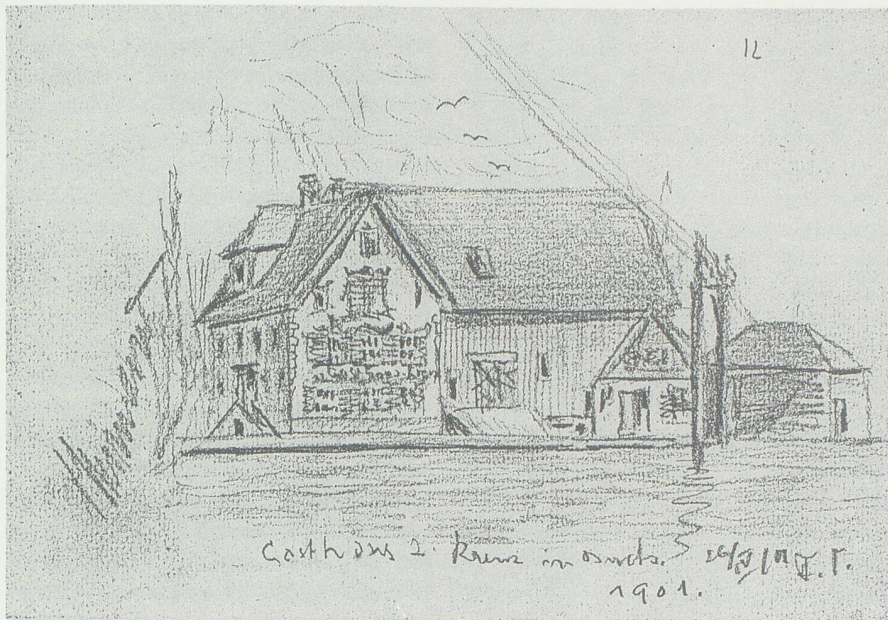
Das Gasthaus zum Kreuz in Werdenberg, 1901. (Bleistiftzeichnung von F. Steinmann, 10 x 15 cm.)

telst eines andern Fuhrwerks den Versuch machen noch einmahl auf Fontnas in mein liebes, altes Heymat zu kommen.