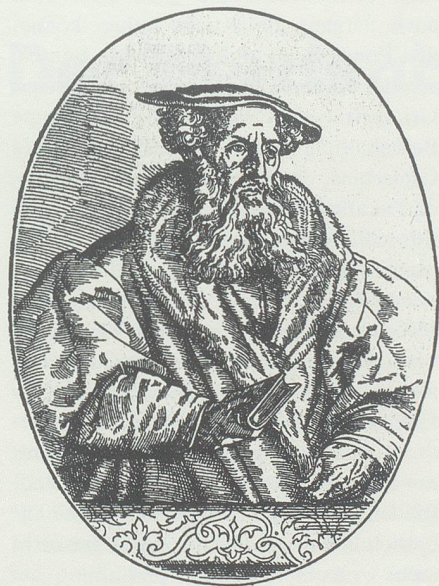
Antistes Heinrich Bullinger, 1504–1575.