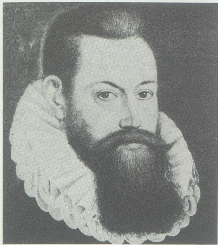
Johann Philipp von Hohensax.

über ist wenig zu erfahren. Lediglich eine kleine Mitteilung, in der ein paar Wartauer dem Landvogt Reding ihr Bedauern ausgedrückt haben, ist vorhanden. Unbekannt hingegen ist, wie der Grossteil der Wartauer über diese kostspielige und langwierige Angelegenheit gedacht hat. Eine heilsame Erkenntnis erleuchtete zu guter Letzt dennoch die über die Köpfe der Untertanen hinweg streitenden Obrigkeiten: In einem «Spiegel» im Anschluss an den Eidgenössischen Abschied heisst es: «Wie die Ungerechtigkeit emporgekommen, [...] zeigt leider die tägliche Erfahrung [...]. Ist's vor dem gerech-