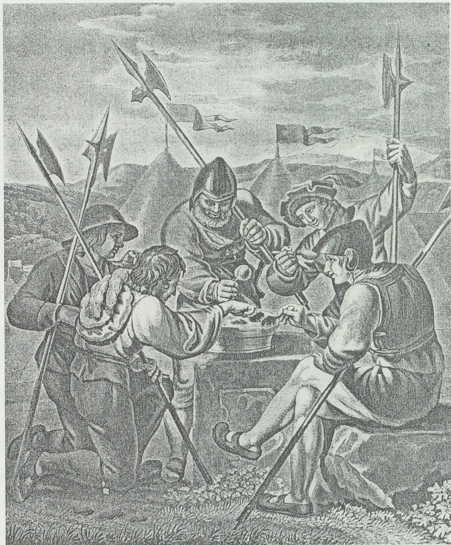
Die Milchsuppe im Kappeler Krieg.

1525 trübte sich das Verhältnis zwischen Herren und Untertanen erstmals: Bauernunruhen wogten allerorten durch die Lande, gleichsam als Begleiterscheinung