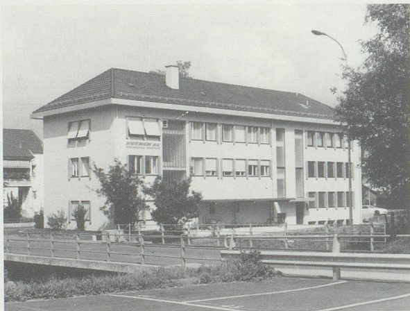
Verwaltungsgebäude der im Jahr 1901 gegründeten internationalen Spedition an der Technikumstrasse, Buchs