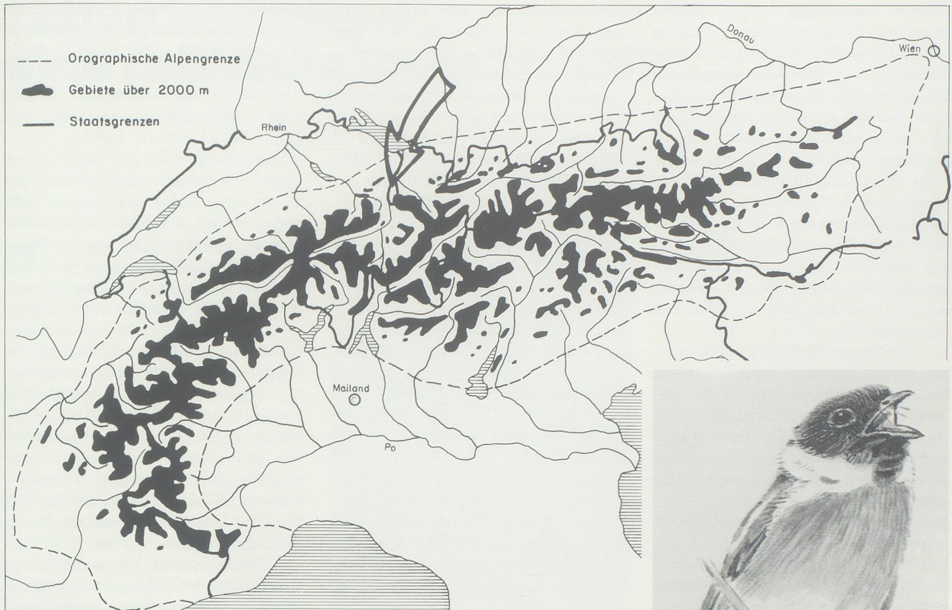
Abbildung 2: Stellung des Rheintals als Vogelzug-Korridor innerhalb des Alpenraumes.

ze und Wasserpieper ist der Rhein gar die einzige Überwinterungsmöglichkeit in unserer Region. Sehr zum Leidwesen der Fischer taucht hier seit 1982 auch immer wieder der Kormoran auf. Diese Art profitierte vom Schutz der Brutplätze im nördlichen Mitteleuropa und Südsandinavien, von wo unsere Wintergäste stammen.