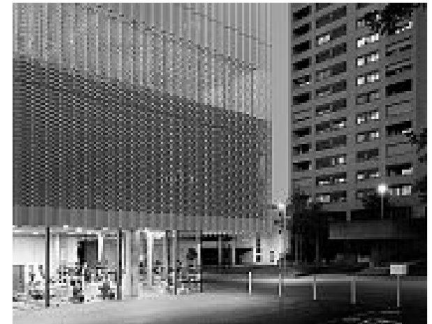
Neubau Sporthalle Hardau, Zürich, 2007 Roger Weber, Zürich, weberbrunner architekten