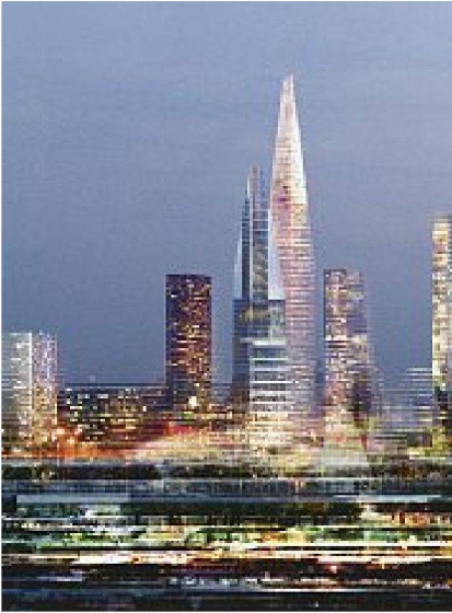
Bilder: Ateliers Jean Nouvel

Verdichtung des gebauten Bestandes von Jean Nouvel, hier im Quartier Genevilliers.