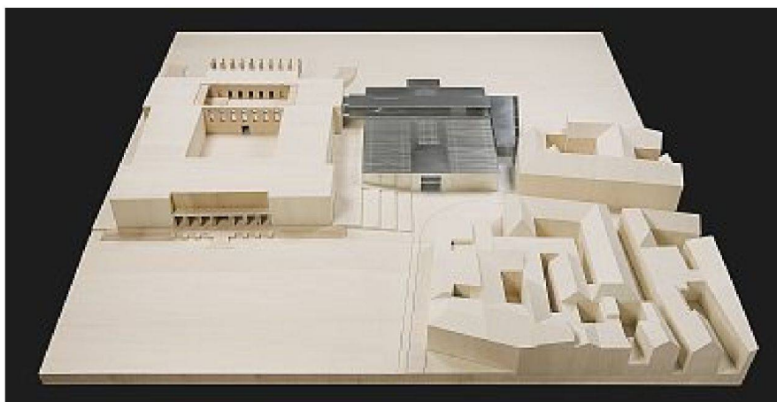
Projekt Anbau Schloss Esterhazy, Eisenstadt; links das Schloss mit Vorplatz, in der Mitte in Metall dargestellt der Anbau, rechts unten Ortskern Eisenstadt.