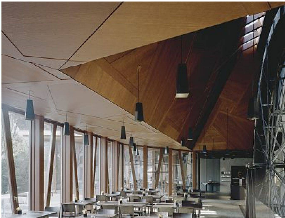
Restaurant mit Blick zum Entree, rechts das alte Mühlensrad