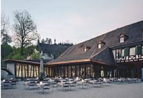
Vorher: Der Platz vor der Klostermühle (oben) Nachher: Neuer Anbau vor dem Mühlengelände (unten)