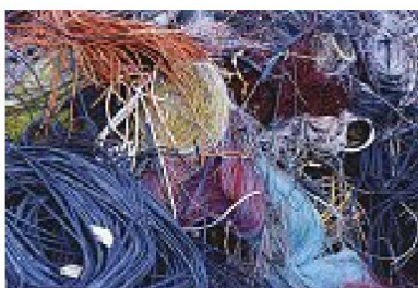
oben links: Einladungskarte Ausstellung Materialarchiv. – Bild: Grafik Tim A. Landheer, ©Gewerbemuseum Winterthur rundum: Materialien aus der Sammlung: Keramikröhren, Aluminium, Tierhaare, Kunststoffkabel. – Bilder: Stephanie Tremp, ©Gewerbemuseum Winterthur

tischen Grundlagen dazu zu präsentieren. Der Abend war trotz der Weite des Feldes spannend und bekam einen aus der Ankündigung noch nicht ablesbaren Zusammenhang, wenn es auch interessant gewesen wäre, die Positionen der drei Vortragenden in einem Gespräch zu konfrontieren. Gerade zwischen Wieser und Roche wäre es zwischen Theorie und Praxis eventuell zu interessanten Kollisionen gekommen. Schliesslich weist Wieser ja auf die synthetischen Materialien als