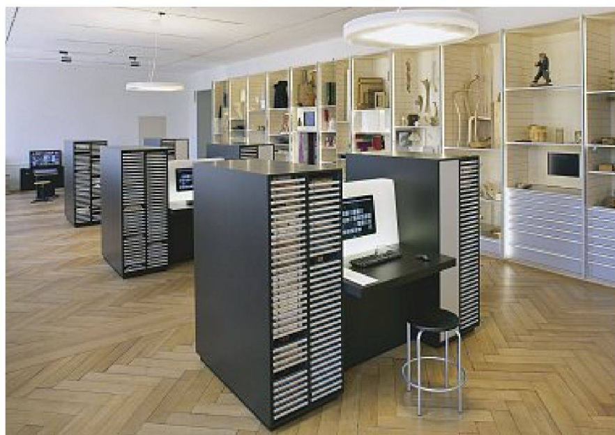
Materialarchiv im Gewerbemuseum Winterthur, Muster- und Schausammlung, Ausstellungsansichten.