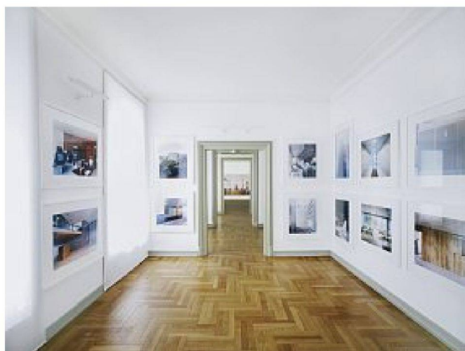
Blicke in die Ausstellung im Schloss Morsbroich: Bilderserie zur Niederländischen Botschaft (links) und die Lauder Business School Wien.

Die Publikationen «Candida Höfer. Projects: Done» und «Candida Höfer. Kuehn Malvezzi» sind im Verlag der Buchhandlung Walther König erschienen.