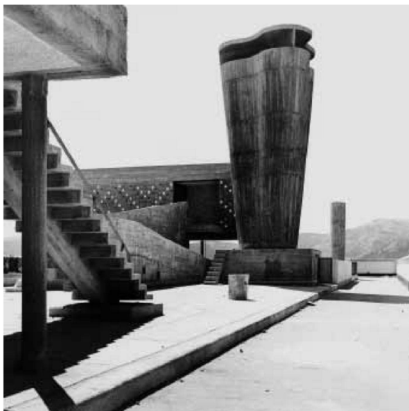
Dachlandschaft der Unité d'habitation in Marseille, 1946–1952

Reise, 1929 in Rio de Janeiro. In rascher Folge wechseln Szenen mit so verschiedenen Sujets wie Wäsche im Wind, auf Schweinen reitende Kinder, Schiffsbeschläge, Wolken oder ein Luftschiff. «Unvermittelt (Serien) erkennen, durch Raum und Zeit hindurch (Einheiten) finden, die Sicht auf Dinge, denen der Mensch seine Präsenz eingeschrieben hat, zum Erlebnis machen». 2 Mit diesem Programm, dieser Methode hatte Le Corbusier «zeitliche Abfolgen, thematische Bindungen und räumliche Trennungen durchbrochen, um das Gefundene dann zu einem neuen Ganzen zu verschmelzen. Als Propagandist und Prophet einer fortschrittlichen Architektur mochte er sich dabei in ein seltsames Licht stellen. Es gelang ihm aber auf diese Weise, den Konflikt zwischen Tradition und Utopie aufzulösen» 3 , schreibt Arthur