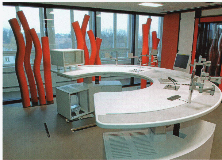
Hauptradiostudio von DRS1 im Zürcher Max Bill Hochhaus

akustische Absorption zu verbinden. Das Radiostudio hat zwei Kriterien zu erfüllen: Es muss schalldicht sein und gute Klangqualität bieten, was in diesem Fall heisst, dass der Raum als solcher nicht hörbar sein soll.