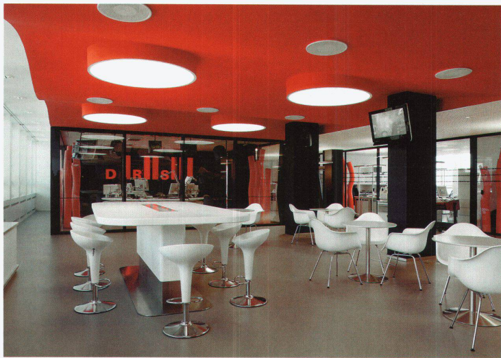
Besprechungszone «Marktplatz» mit Radiostudio von DRS1 im Hintergrund