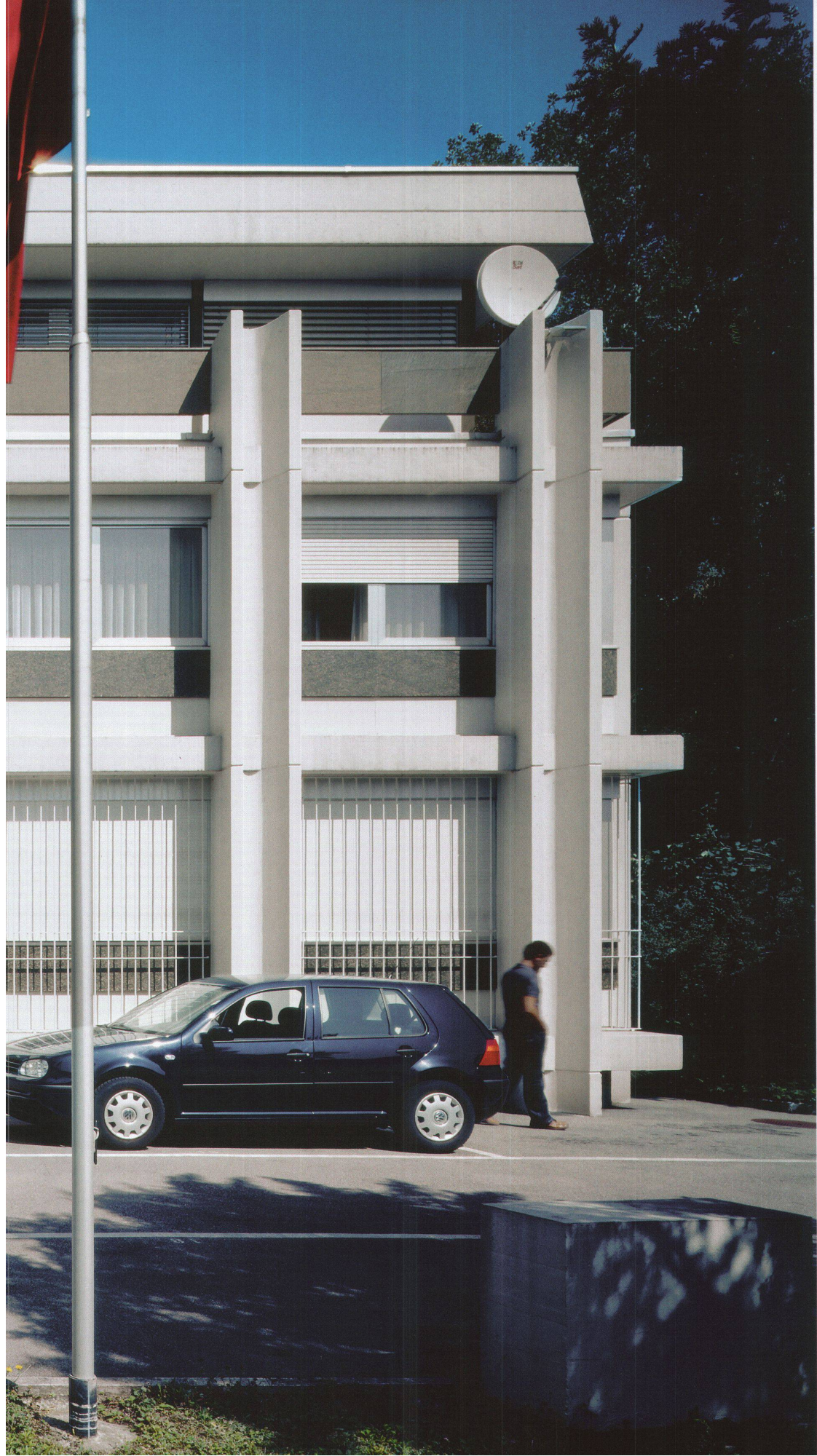
Türkische Botschaft, Bern