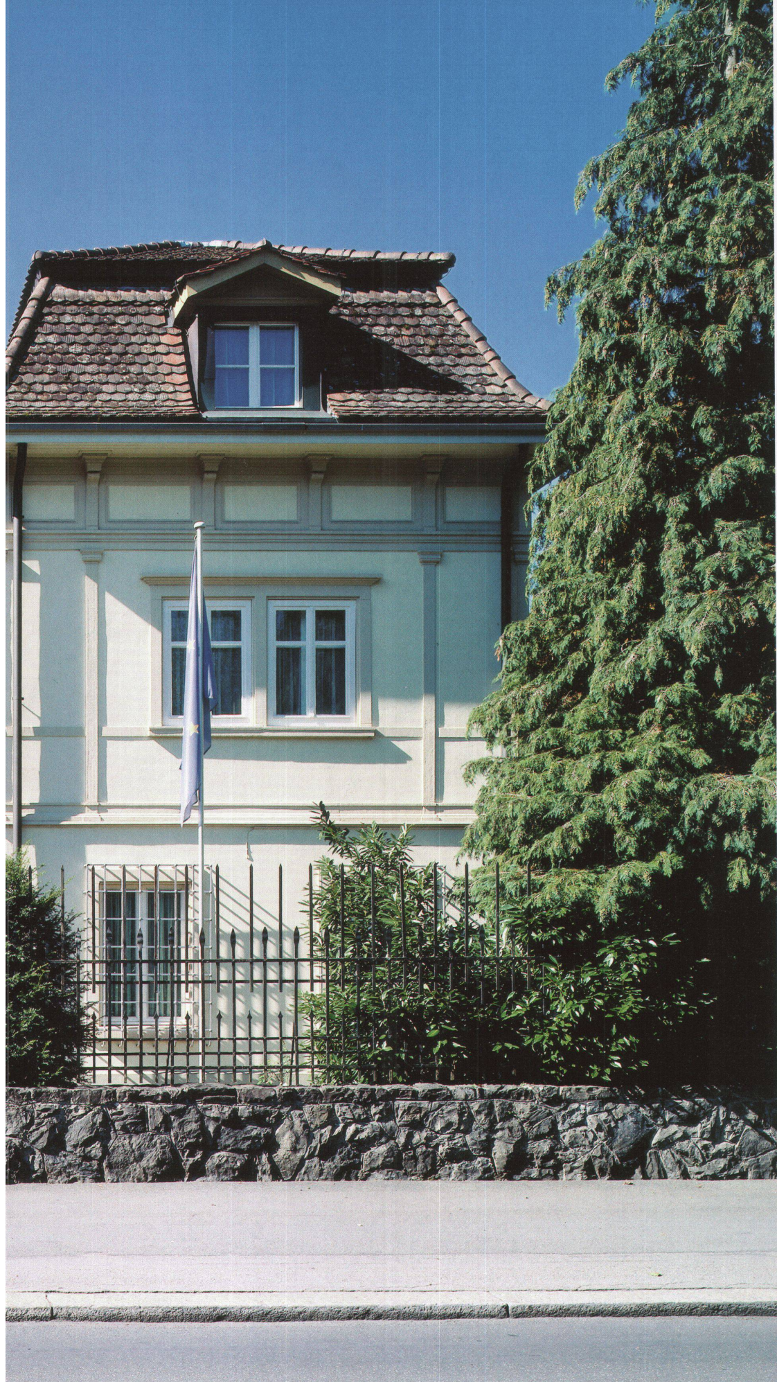
Italienische Botschaft, Bern