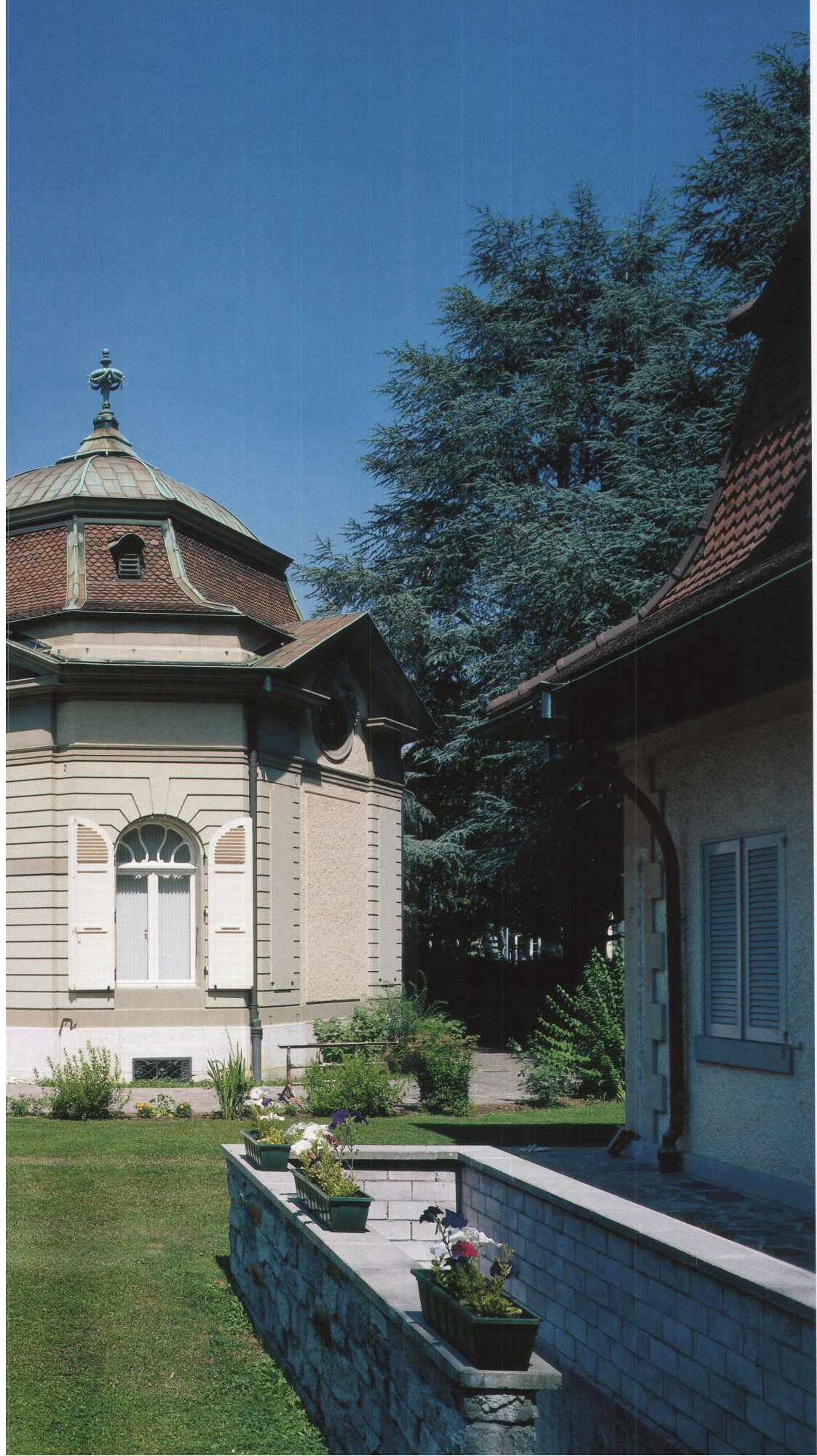
Päpstliche Nuntiatur, Bern