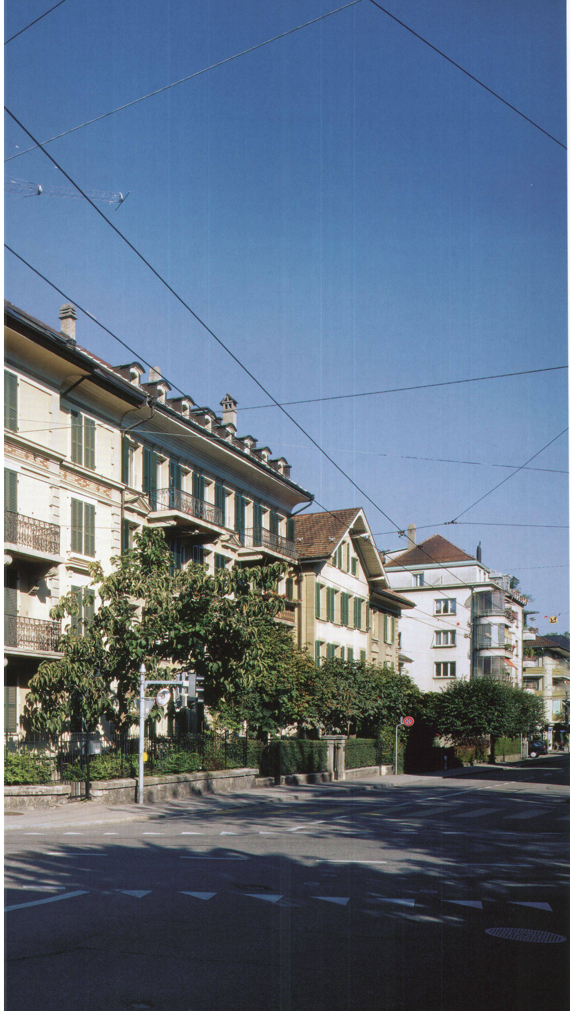
Nigerianische Botschaft, Bern