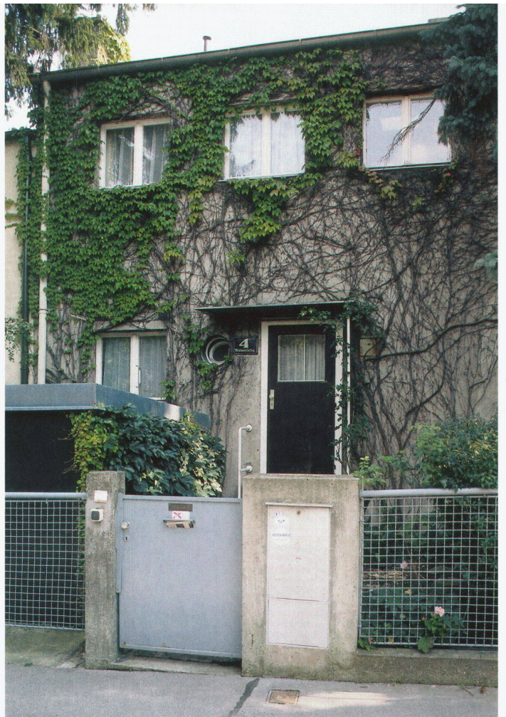
Linke Seite: Über die Zeit individuell gestaltete Reihenhaussiedlung in Canterbury

Muss noch darauf hingewiesen werden, dass dieser Wandel in der Zeit auch das Miteinander von alter und neuer Architektur bedeutet? Ebenso, wie in einer alten Stadt ein Neubau in alten Strukturen und Nutzungen Fortsetzung und neue Perspektive verspricht, so kann auch in gewaltigen Neubaukomplexen die Präsenz eines Altbaus, der durchaus nicht Baudenkmal