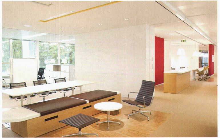
Plan und Bild: Novartis-Gelände Basel, Gebäude WSJ 202.3

Sevil Peach, geboren 1949 in der Türkei, studierte Interior Design an der Universität von Brighton. Nach Mitarbeit in verschiedenen Architektur- und Designbüros in London und Istanbul gründete sie 1994 zusammen mit Gary Turnbull ihr eigenes Studio Sevil Peach Gence Associates SPGA. Das Studio gestaltete unter anderem die Büros der Vitra GmbH in Weil am Rhein (1998), das Hauptquartier von MEXX in Amsterdam (2003) oder ein Pilotprojekt für neue Arbeitswelten für Novartis in Basel (2003).