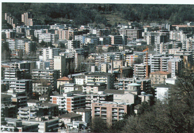
Eine Peripherie ohne öffentliche Räume

Fumagalli: Man kann diese Entwicklung klar umreissen. Nach der ersten Generation, von Tami und