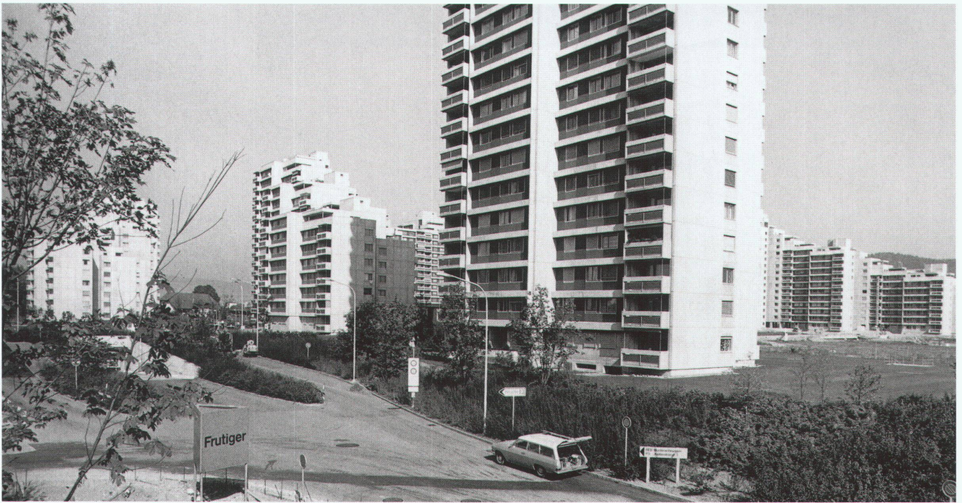
Westliche Zufahrt mit Rampe zur unterirdischen Verkehrsebene (um 1976)

nales Einkaufszentrum vorgesehen. Die Planung sollte somit, als städtebauliche Grosseinheit am Stadtrand, die Sogwirkung des Stadtzentrums brechen und regional für eine ausgeglichene Entwicklung sorgen. Die über 5500 Wohnungen verteilten sich auf sieben bebauungsmässige unterschiedliche Quartiere. Die beiden hauptsächlichen Bebauungstypen bildeten einerseits Punkthochhäuser mit über zwanzig Stockwerken und andererseits stufenförmig gestaffelte Kettenhäuser mit zwischen fünf und fünfzehn Etagen, die zu Nachbarschaften gruppiert wurden. In einigen Quartieren wurden diese Typen mit Einfamilienhäusern ergänzt. Zudem war ein Quartier als reines Villenquartier geplant.