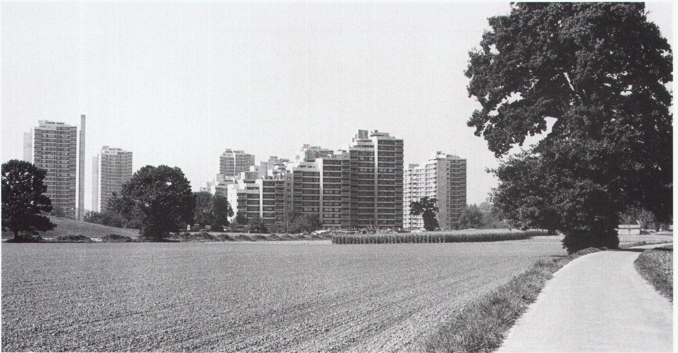
Blick vom Melchenbühlweg auf die Überbauung (um 1976)

bodenpolitisch unter ausnehmend günstigen Vorzeichen. Normalerweise scheiterten nämlich städtebauliche Grossvorhaben bereits an der starken Zersplitterung des Bodeneigentums. Im Oberen Murifeld hingegen konzentrierte sich der Bodenbesitz weitgehend auf die Burggemeinde und die Erbgemeinschaft Wittigkofen. Damit herrschten gewissermassen städtebauliche Laborbedingungen, die – zusätzlich gestützt durch überaus kooperationsbereite Behörden – die Ausarbeitung «zeitgemässer» städtebaulicher Lösungen ermöglichten.