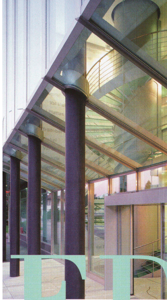
Die dreigeschossige Eingangshalle, transparentes Herzstück des neuen Verwaltungsgebäude der EWBO/OES AG. Illanz. Architekt: Jakob Moutaka.