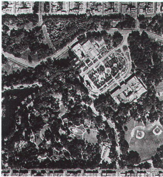
Luftaufnahme des M.H. de Young Memorial Museum, Golden Gate Park, San Francisco

Das Verfahren nennt sich Auswahl nach Präqualifikation. Damit werden Architekten gesucht, die in der Lage sind, «ein Wahrzeichen» zu schaffen. Die Basler Architekten Herzog & de Meuron sind gleich zweimal in den USA zum Zuge gekommen.