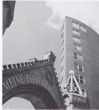
Josef Paul Kleihues: Büroturnm, Brunnenstrasse, Berlin

Darüber, welche Rolle er im heutigen Baugeschehen der Hauptstadt spielt, ist in den letzten Jahren viel debattiert worden. Doch die dichotome Gegenüberstellung von Materialien wie Glas (= modern) und Stein (= traditionell), wie sie die Diskussion um die Berliner Architektur in ihrer ganzen intellektuellen Verkürzung bestimmte, stellt einen Anachronismus dar, mit dem Kleihues nichts zu schaffen hat, obgleich er doch beständig als Protagonist des «Architekten-Kartells»