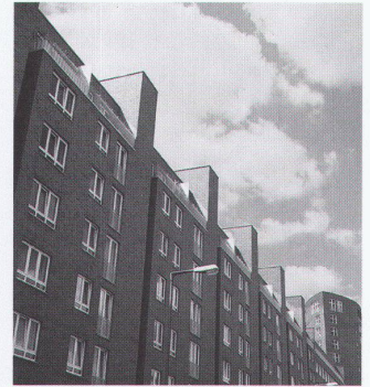
Josef Paul Kleihues: Wohnüberbauung Brunnenstrasse, Berlin

genannt wurde. Trotz eines weltweiten Aktionsradius – was seine Bauten, aber auch seine Bewunderer angeht – darf Berlin nach wie vor als Mittelpunkt seines Wirkens gelten: Das zeigen nicht nur «Kontorhaus Mitte» und «Triangel-Haus» an der Friedrichstrasse, sondern auch der Umbau des Hamburger Bahnhofs. Den Boden für solche Projekte hat er selbst bereitet: Zwar nicht allein, aber doch in verantwortlicher Position organisierte er seit 1979 die Internationale Bauausstellung (IBA) und verhalf ihr zu einer Aufsehen erregenden Umsetzung. Und das seinerzeitige Programm ist, wie das «Planwerk Innenstadt» signalisiert, immer noch en vogue. Denn damals wie heute sollte die Aufnahme und Neuinterpretation überlieferter Stadtstrukturen vornehmlich zur Rückgewinnung der Stadt als Wohn- und Lebensraum dienen. Ein hehrer Anspruch!