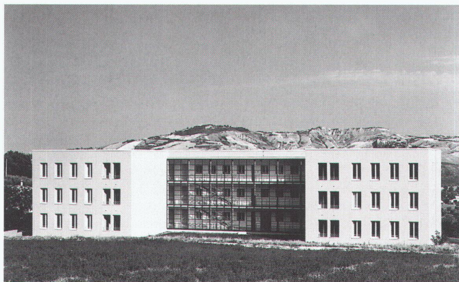
Nicola Di Battista: Wohnhaus in Teramo, 1987–1994

Zur Eröffnung der Ausstellung sprechen Vittorio Magnago Lampugnani sowie Nicola Di Battista, Rom, und Doris Wälchli, Lausanne, am 7. Januar 1999 um 18.00 Uhr im Auditorium E4 der ETH-Höggerberg. Die Ausstellung dauert bis 25. Februar 1999.