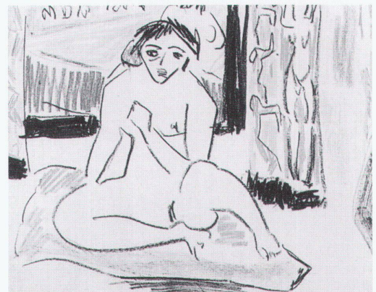
Ulm, Museum: Ernst Ludwig Kirchner, Weiblicher Akt vor dem Spiegel

München, Hypo-Kulturstiftung Picassos Sammlung anderer Künstler wie Balthus, Braque, Cézanne, Corot, Courbet, Degas, Matisse, Miró, Renoir, Rousseau und Bilder von ihm selbst 30.4.–16.8.