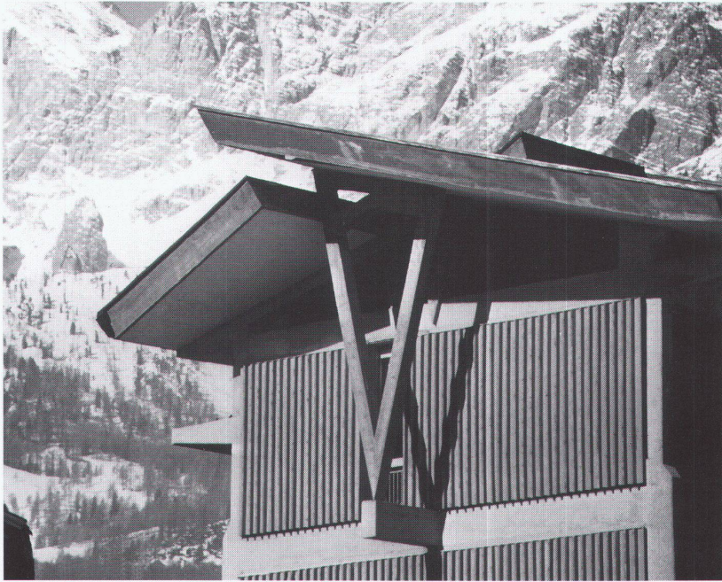
Zürich, ETH Höggerberg: Edoardo Gellner, Gebäude für die Telve, die Post und öffentliche Ämter, Cortina d'Ampezzo 1953–1955, Ausschnitt Südostfront

Berlin, Bauhaus-Archiv. Museum für Gestaltung Andreas Feininger: Photographs 1928–1988 bis 1.6.