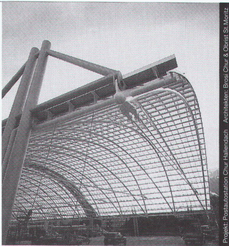
Projekt: Postautostation Chur, Hallendach. Architekten: Brossi, Chur & Obrist, St. Moritz.

Stahl-Glas-Konstruktionen in architektonisch perfekter Vollendung verwirklichen wir mit innovativen Ideen und höchsten Anforderungen an Materialien und Ausführung.