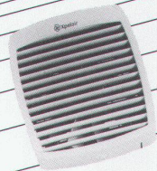
Fenster- und Wandventilatoren