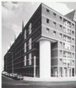
Berlin, Kochstrasse, 1986–1988

Die Ausstellung «Einblicke in die Lehre» – Diplomarbeiten im Sommersemester 1993 bei Jürgen Joedicke – ist im Foyer des Kollegiengebäudes I vom 24. Juni bis 5. Juli 1993 zu sehen.