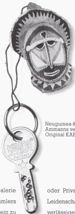
Neuguinea-Kenner Ammanns verlässlicher Original KABA® STAR.

Unikate eingeschlossen. Tragödie ausgeschlossen.