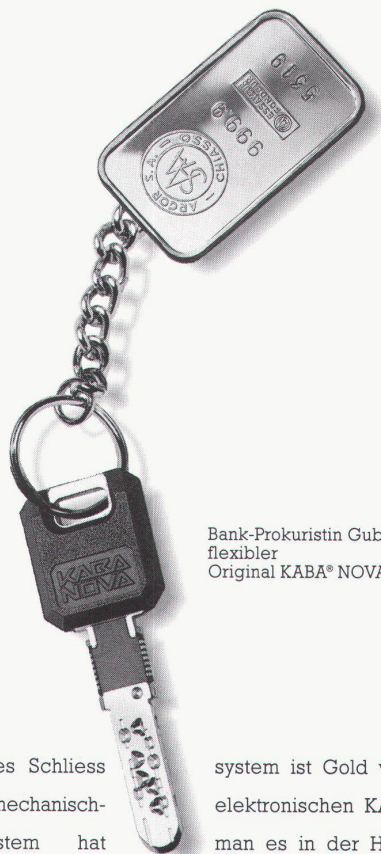
Bank-Prokuristin Gublers flexibler Original KABA® NOVA.

Ein kluges Schliesssystem ist Gold wert. Mit dem mechanisch-elektronischen KABA® NOVA-System hat man es in der Hand, wechselnde örtliche und zeitliche Zutrittsberechtigungen beliebig oft und auf einfache Weise umzuprogrammieren. Das schafft organisatorische Flexibilität und spart Verwaltungsaufwand. Und geht einmal ein Schlüssel verloren, ersetzt und blockiert ein Ersatzschlüssel den verlorenen Schlüssel. Kein Wunder, dass KABA® NOVA-Schliesssysteme vor allem auch in Banken und Versicherungen schon ganz schön Karriere gemacht haben.