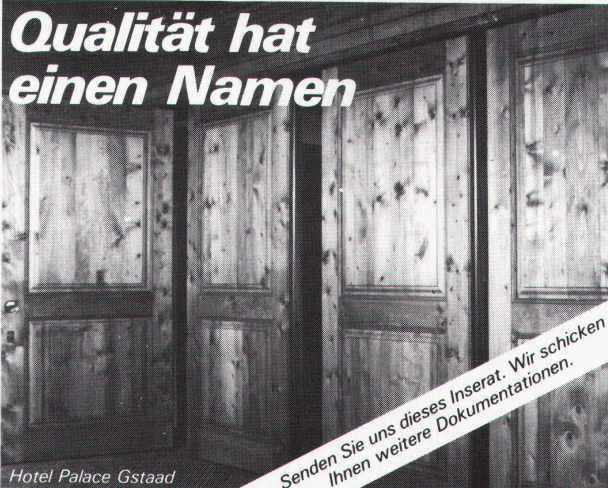
Hotel Palace Gstaad

Senden Sie uns dieses Inserat. Wir schicken Ihnen weitere Dokumentationen.