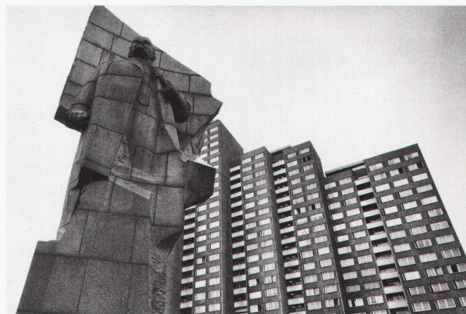
3 4 Lenin-Denkmal am Lenin-Platz, Ost-Berlin; Bildhauer: Nikolai Tomski