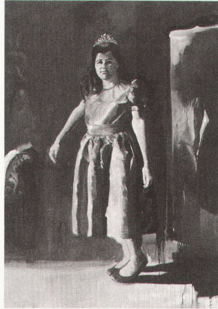
Musée cantonal des Beaux-Arts Lausanne: Eric Fischl, The Green Dress, 1987

Liverpool, Tate Gallery Francis Bacon Expression & Engagement – Ger-