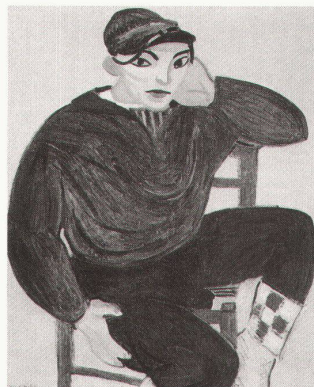
Royal Academy of Arts, London: Henri Matisse, 1869–1954, The Young Sailor II, 1906

New York, Whitney Museum of Modern Art Hunt Diederich bis 22.7.