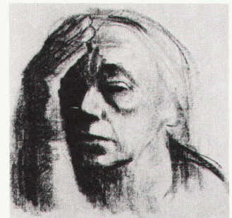
Käthe Kollwitz: Selbstbildnis, um 1920

Die Ausstellung im Graphi- schen Kabinett «Käthe Kollwitz – die Zeichnerin» stellt mit rund 120 Zeichnungen das einer weiteren Öff- entlichkeit noch weitgehend unbe- kannte zeichnerische Werk der Künstlerin vor. Spontaner und direk- ter als in der Druckgraphik kommt in den Zeichnungen Käthe Kollwitz'