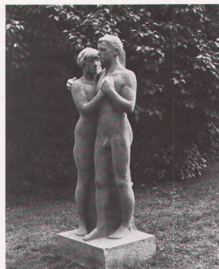
Otto Roos: Zwei Menschen, 1916. Sandstein, Kunstmuseum Basel