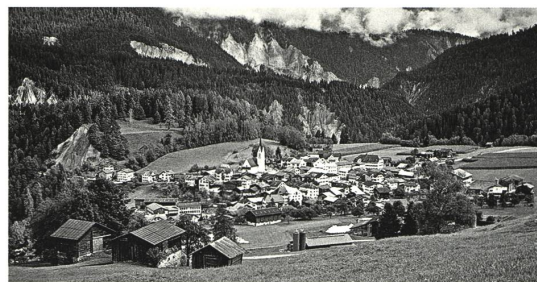
Das Bündner Bergdorf Valendas im HDA Graz: LandLeben

München Architekturmuseum der TUM Die Architekturmachine. Die Rolle des Computers in der Architektur bis 10.1.2021 www.architekturmuseum.de