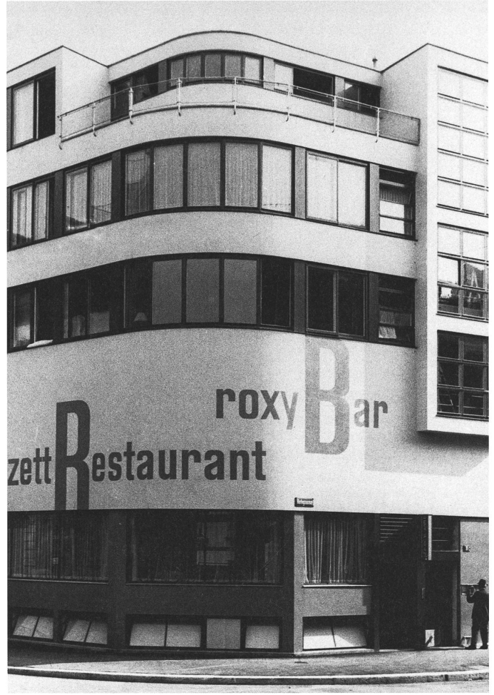
Das Zett-Haus von Flora Steiger-Crawford (u.a.), Zürich 1932.