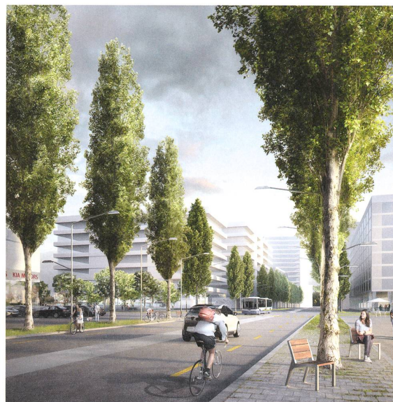
Gestaltungskonzept Nidfeldstrasse, Kriens. Breite Trottoirs mit Säuleneichen begleiten die Strasse.