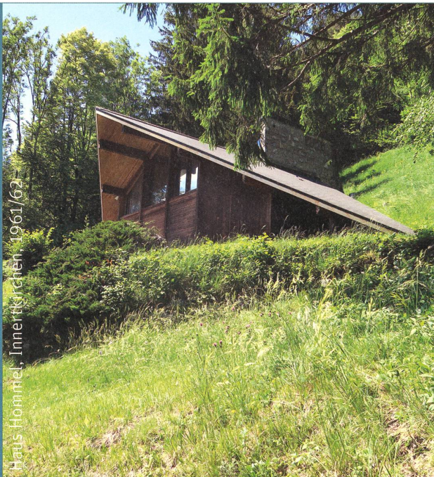
Haus Hommel, Innerkirchlen, 1961/62

17. und 20.9. Bern und Thun Berner Fachhochschule Architektursymposium 2019 Vom Umgang mit dem Ort Ernst Andereg im Berner Oberland www.ahb.bfh.ch/ architektursymposium