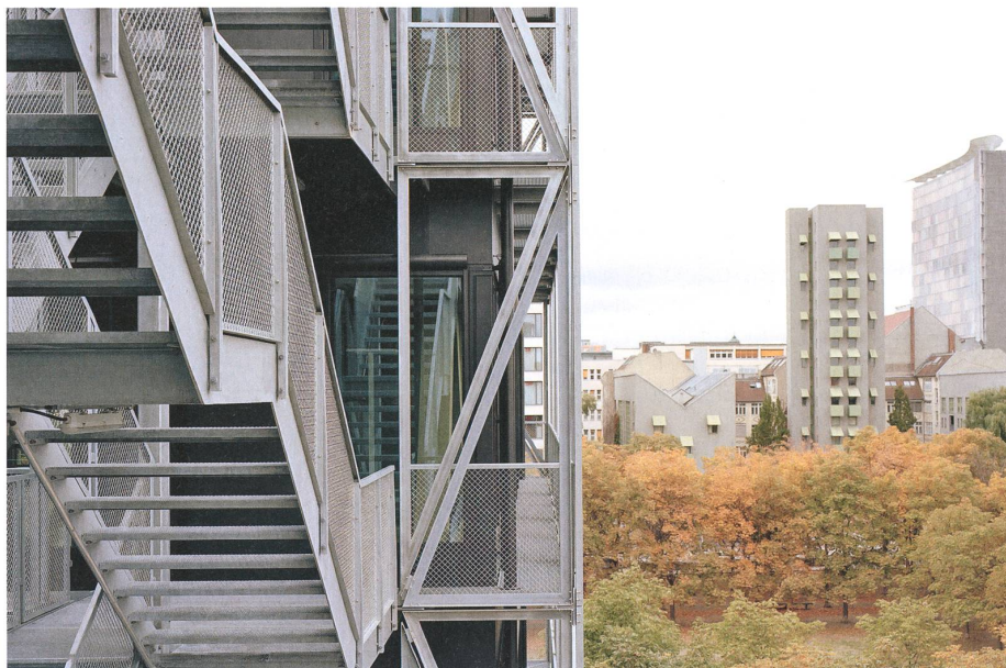
Mit technisch geprägter und offener Architektur definiert der TAZ-Neubau an der Südlichen Friedrichstrasse die Zentrale der erfolgreichen linken Tageszeitung. → S. 14