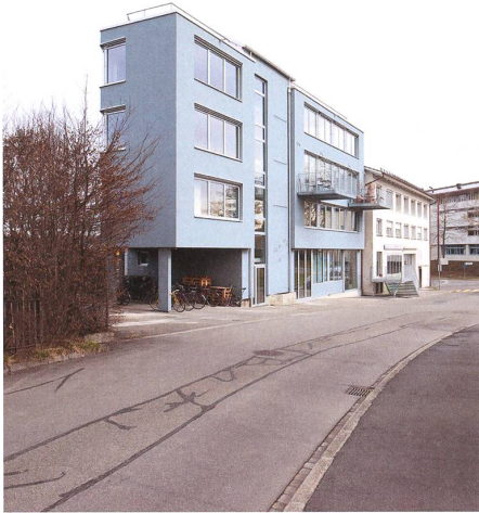
Zu Wohnungen und Ateliers umgebaut, gibt dieser Gewerbebau in Bern Anlass, über den Wert gewöhnlicher Architektur nachzudenken. → S. 56