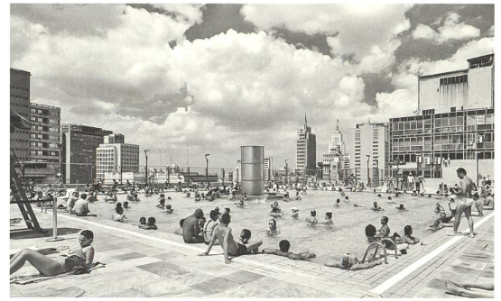
Paulo Mendes da Rocha und MMBB: SESC 24 Maio, São Paulo, Brasilien, 2017

Wien Az W Critical Care Architektur für einen Planeten in der Krise bis 9.9. www.azw.at