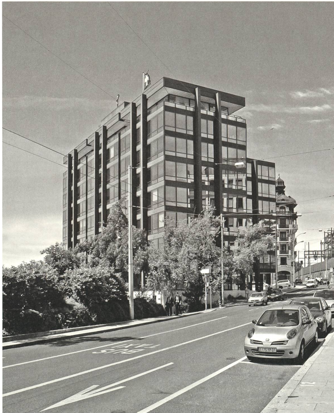
Oben: Patinoire des Vernets in Genf, 1954–58, Hauptfassade mit Tragwerk der Haupttribüne. Unten: Das 2011–16 aufgestockte und energetisch ertüchtigte Bürohaus der Fédération des syndicats patronaux in Genf, 1959–66.