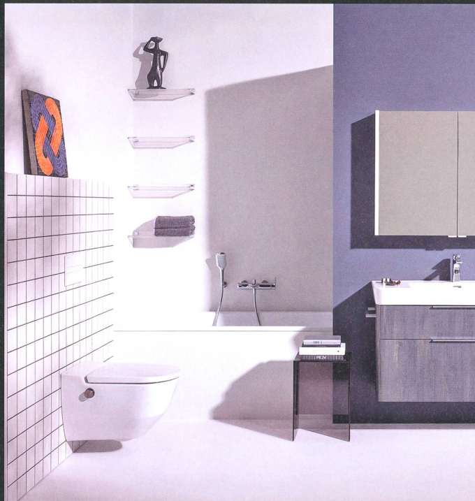
Keramik Laufen AG Wahlenstrasse 46, CH-4242 Laufen T +41 61 765 71 11 www.laufen.ch → Swissbau: Halle 2.2, Stand A18

Bei Cleanet Navia ist die Schallentkoppelung bereits integriert und sorgt dafür, dass weniger Nutzungs- und Funktionsgeräusche auf die Wand und damit in die Nachbarzimmer übertragen werden. Dieses System erfüllt die erhöhten Schallschutz-Anforderungen nach SIA 181 sowie DIN 4109 und wurde durch das Fraunhofer Institut zertifiziert.